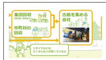
たくさんの方がリサイクルに関わっている。