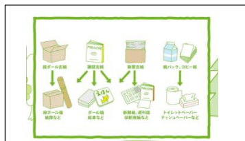
リサイクルで一番大切なのは分別