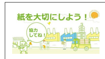
これからも紙を大切に。