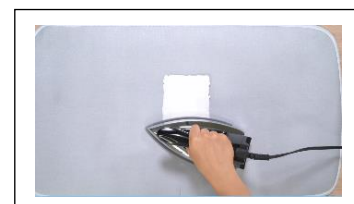
脱水してアイロンでしっかり乾かす