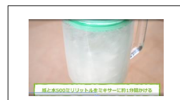
ミキサーで紙をバラバラにする