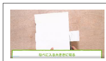
牛乳パックを洗って切り開く