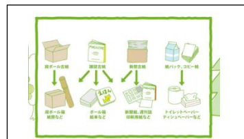
リサイクルで一番大切なのは分別