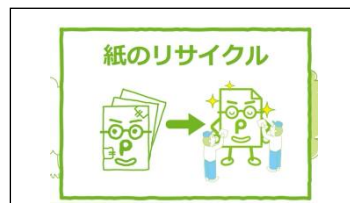
使い終わった紙は、リサイクルできる。