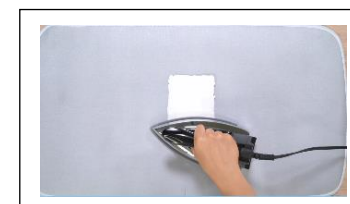
脱水してアイロンでしっかり乾かす