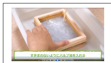
抄き枠にパルプ液を流し紙を抄く