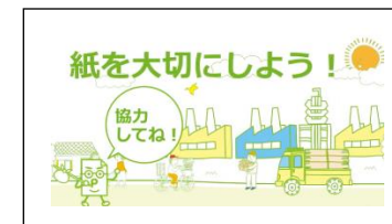
これからも紙を大切に。