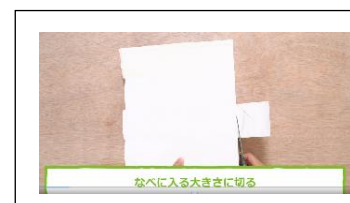
牛乳パックを洗って切り開く