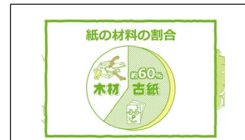
紙の材料の60%が古紙！