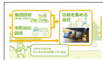
たくさんの方がリサイクルに関わっている。