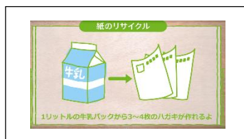
牛乳パックからはがきを作ってみよう

紙のリサイクル実践編として、身近な材料を使って、牛乳パックから「はがき」を作る工程をやさしく解説しています。できた「はがき」は、手づくり絵はがきコンクールにご応募頂けます。