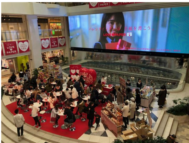
昨年のイベント実施時の様子