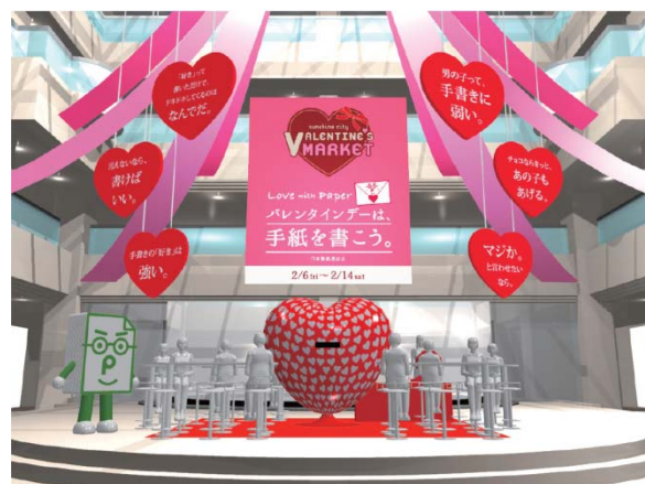
「バレンタインデーは、手紙を書こう。」 イベント会場イメージ