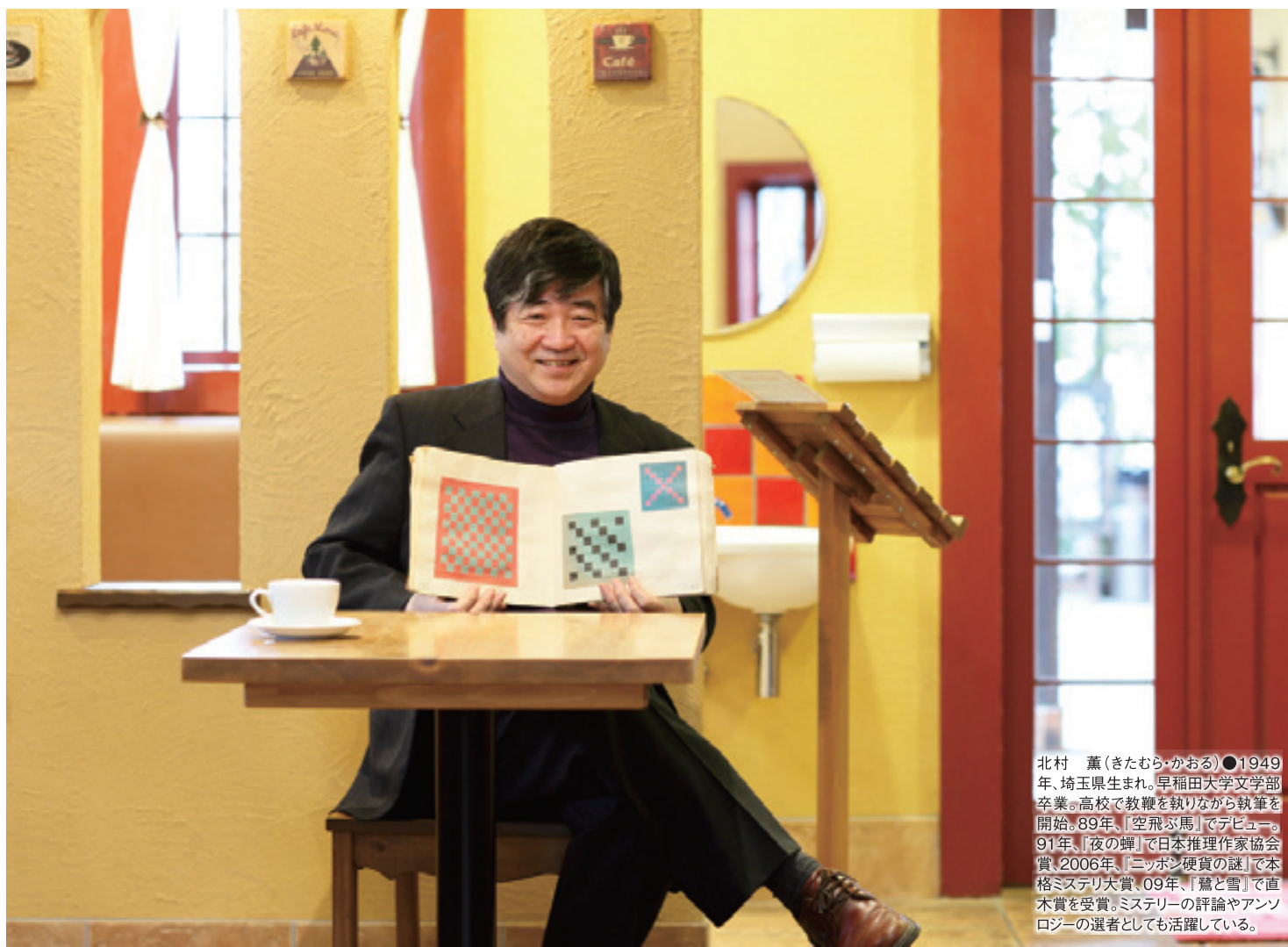
北村 薫(きたむら・かおる) ●1949年、埼玉県生まれ。早稲田大学文学部卒業。高校で教鞭を執りながら執筆を開始。89年、「空飛ぶ馬」でデビュー。91年、「夜の蟬」で日本推理作家協会賞、2006年、「ニッポン硬貨の謎」で本格ミステリ大賞、09年、「霧と雪」で直木賞を受賞。ミステリーの評論やアンソロジーの選者としても活躍している。

なものだとすれば、奇しくも同じ物書きとして、父をよく知る私が、その後を紡いでいくのは運命なのかもしれない。そんな想いが私の背中を強く押し、大きな時の流れとその中で翻弄されながらも力強く生きていく人々を描き出すことができたのではないかと思う。