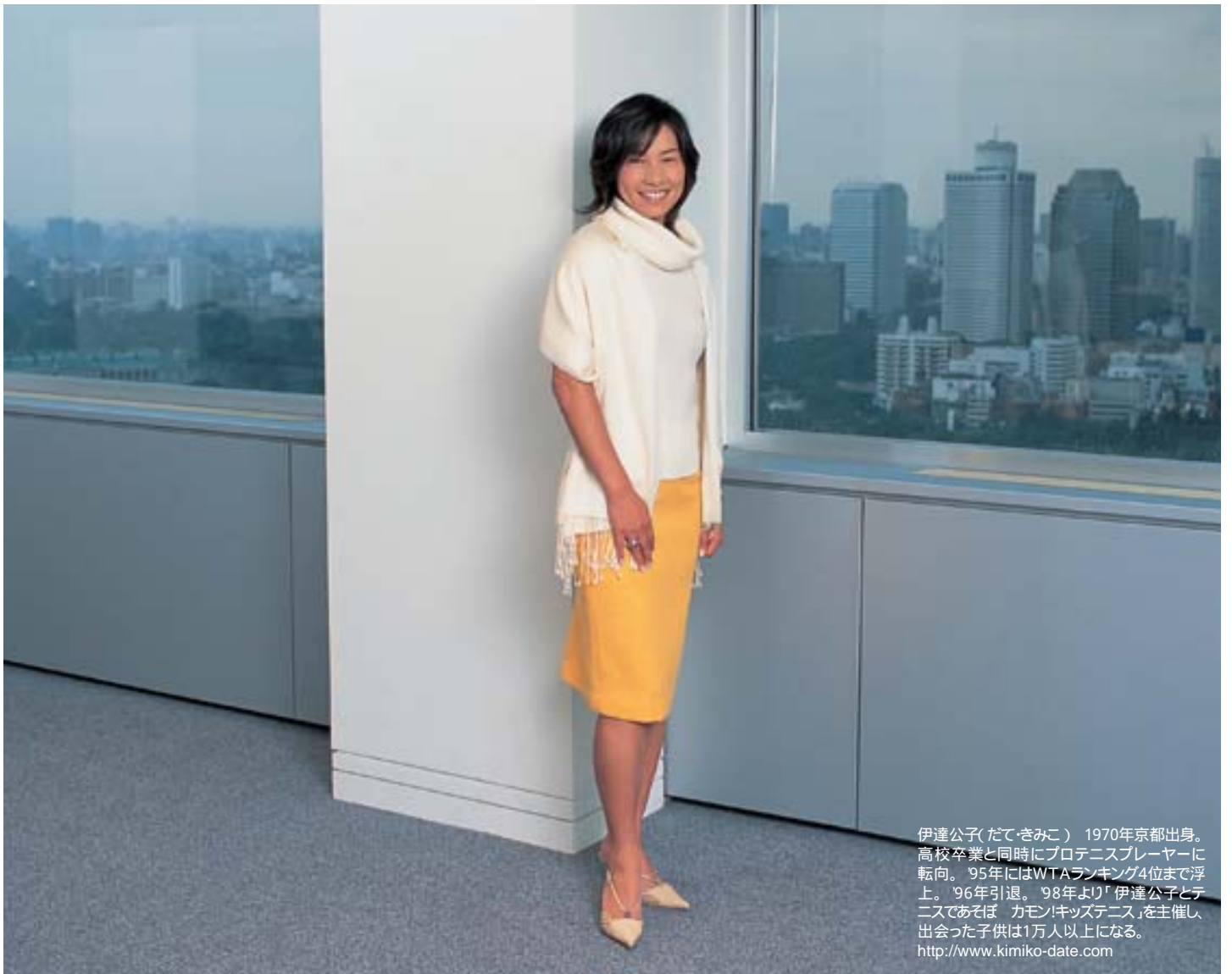
伊達公子(だて・きみこ) 1970年京都出身。高校卒業と同時にプロテニスプレーヤーに転向。95年にはWTAランキング4位まで上昇。96年引退。98年より「伊達公子とテニスであそぼ カモン!キッズテニス」を主催し、出会った子供は1万人以上になる。 http://www.kimiko-date.com

キッズテニスに参加した子供たちから送られてくる、たくさんのお手紙や絵、嬉しさが素直に表現されているそれらの手紙は、私の元気の源です。そんな手紙を読むたびに、もっともっと多くの子供たちに、テニスの楽しさを伝えていきたいと思えます。