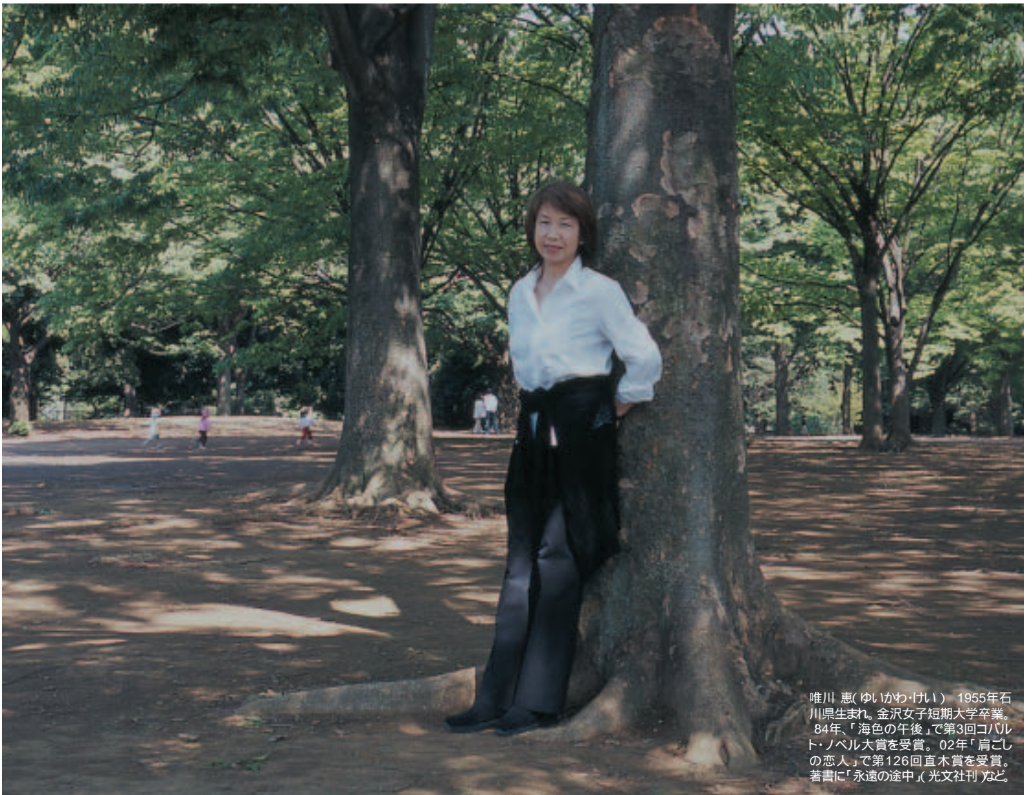
唯川 恵(ゆいかわい) 1955年石川県生まれ。金沢女子短期大学卒業。84年、「海色の午後」で第3回コハルト・ノベル大賞を受賞。02年「肩ごしの恋人」で第126回直木賞を受賞。著書に「永遠の途中」(光文社刊)など。

見えた。くしゃくしゃなのをやつと伸ばしたものだつたり、札の隅に数字や文字が書き込まれていたり、染みがついていたり、水に浸したようにこわこわしているものもある。